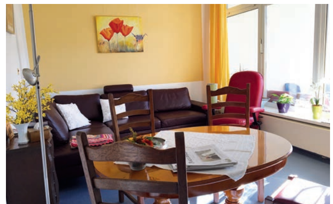
Ein Raum für Gespräche: Das Wohnzimmer der Station

Das Projekt „Biografiearbeit“. Weitere Informationen dazu: www.palliativbonn.de/ich-koennte-ein-buch-schreiben