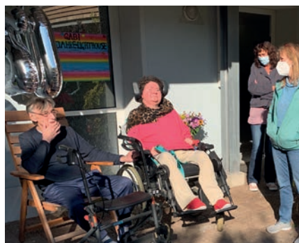
Ein großes Fest zu Ehren unserer „Lighthouse Queen“. Sie lebt seit 20 Jahren im Wohnprojekt.