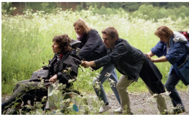
Ausflug mit Bewohner*innen des Wohnprojekts ins Sauerland