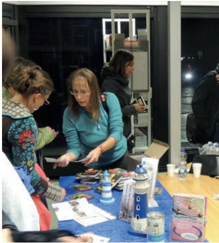
Infostand nach einer Benefizlesung in der Stadtbibliothek Bonn