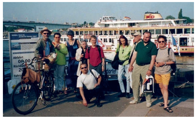
Schiffsausflug mit Bewohner*innen des Wohnprojekts