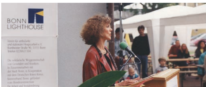
Eröffnung des Wohnprojekts 1994 durch die damalige Oberbürgermeisterin Bärbel Dieckmann