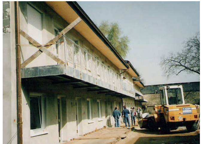
Umbaumaßnahmen der Wohnanlage in der Bornheimer Straße

Derzeit können in unserem Wohnprojekt bis zu 16 Menschen mit schweren chronischen, lebensverkürzenden Krankheiten (z. B. HIV/AIDS, Krebs, COPD oder fortgeschrittenen Lebererkrankungen) leben, die zur Bewältigung ihres Alltages Unterstützung brauchen. Psychosoziale Fachkräfte leisten die Beratung, Begleitung und Betreuung. Sie werden dabei von ehrenamtlichen Mitarbeiterinnen und Mitarbeitern unterstützt.