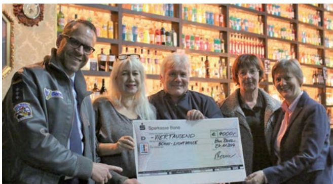
Die BigBand der Bundeswehr gibt Benefizkonzerte zugunsten von Bonn Lighthouse im Pantheon