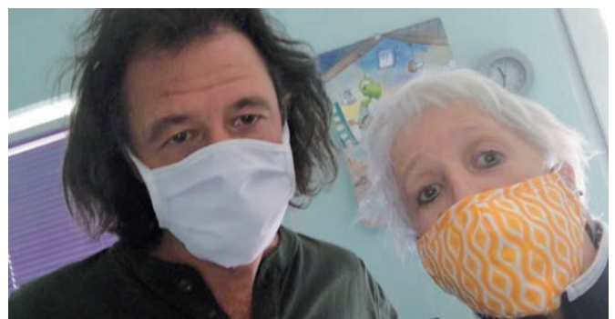
Hauptamtliche Mitarbeiter*innen während der Pandemie. Vom Wohnprojekt konnte Corona bisher ferngehalten werden.