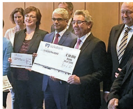
Spende von der Heinz-Dörks-Stiftung anlässlich ihres 50-jährigen Jubiläums