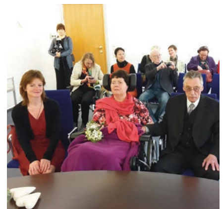
Hochzeit bei Lighthouse

Wer mehr über uns und unsere Arbeit wissen will, findet Infos auf unserer Homepage www.bonn-lighthouse.de Zum Jubiläumsjahr gibt es Bonn Lighthouse auch auf Video. Der Journalist Daniel Gowitzke hat einen kurzen Film über unsere Arbeit gedreht. Schauen Sie vorbei: https://bonn-lighthouse.de/ueber-uns