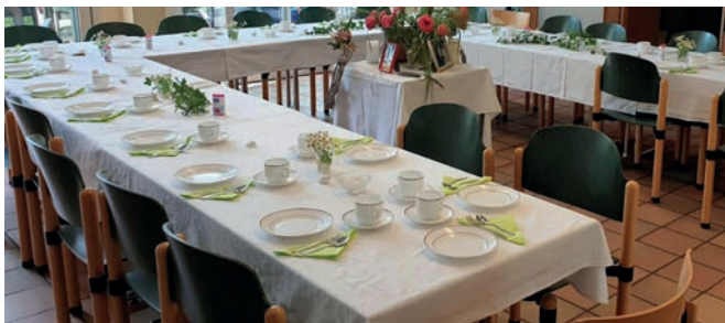
Kreativ Café im Angela-Fey-Haus. Da zu Coronazeiten das Café nicht vor Ort stattfinden konnte, schickten die Ehrenamtlichen regelmäßig kleine Päckchen mit Naschereien und Bastelideen an die Kreativ-Café-Gruppe.

Der ambulante Hospizdienst von Bonn Lighthouse in den Einrichtungen der Behindertenhilfe wird hoch geschätzt. Für die Betreuung und Begleitung von schwerstkranken, sterbenden Bewohner*innen fehlt den Mitarbeiter*innen oft die Zeit und auch die Erfahrung der Lighthouse-Kolleg*innen. Sie sind auch nicht dafür ausgebildet.