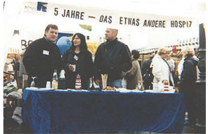
Infostand zum fünfjährigen Jubiläum des Wohnprojekts