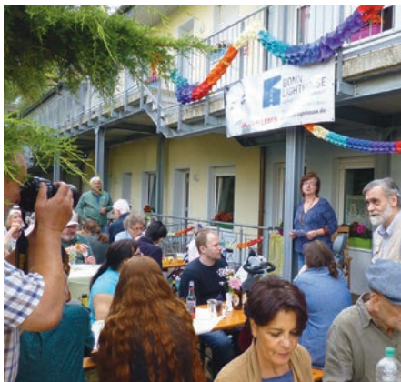
Sommerfeste im Garten des Wohnprojekts