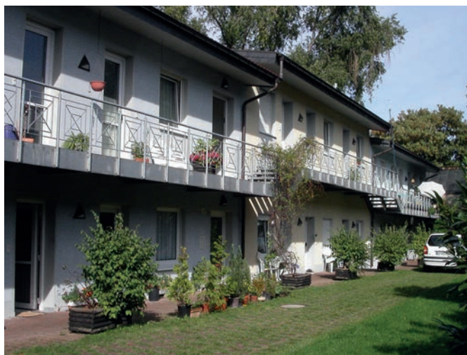
Alle 16 Apartments sind mit Bad und Küchenzeile ausgestattet. Die Räume lassen sich je nach Bedarf den pflegerischen Anforderungen anpassen.