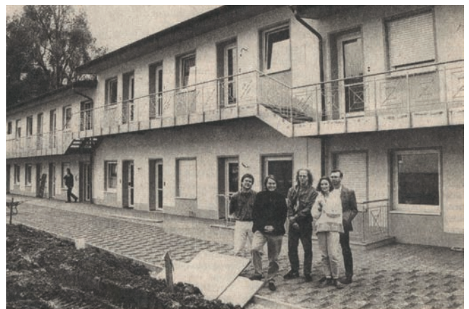
Im Winkel von Adolf- und Bornheimer Straße entstanden 18 Appartements für chronisch schwerkranke Menschen.