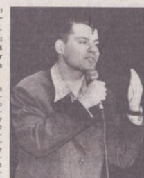
Seine Späße trieb Ingo Appelt auf der Springmaus-Bühne.

Mit älteren Menschen geht der Komiker mit der Mephisto-Frisur ohnehin nicht gerade zupfänglich um: „Im Zivildienst haben wir um die Tabletten der Patienten geschickt. Vielleicht hätte der eine oder andere beim Heranziehen die Pillen gebraucht, aber: verlorene ist verloren.“ Bei solch makabren