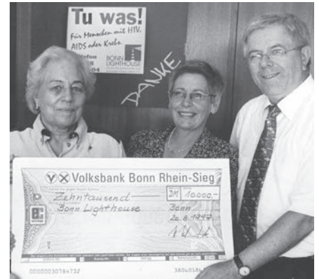
Die Firma Hebenstreit-Kentrup spendete anlässlich ihres 75. Firmenjubiläums.