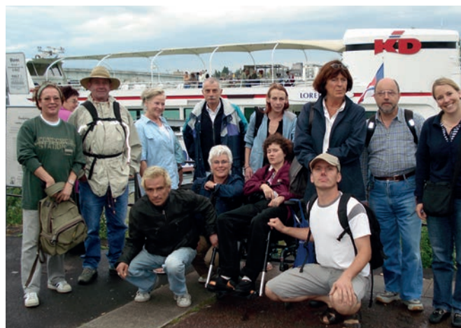
Im Betreuten Wohnen geht es nicht allein darum, den Bewohner*innen Wohnraum und eine pflegerische Versorgung zu bieten. Es werden regelmäßig gemeinsame Veranstaltungen und Ausflüge geplant, an denen, wer mag, teilnehmen kann.