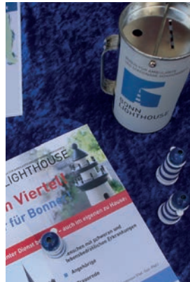
Unser Infostand mit Spendendose