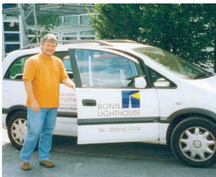
Das erste Vereinsauto – gestiftet von der Aktion „Weihnachtslicht“ und dem Rotary-Club Bonn-Siegburg