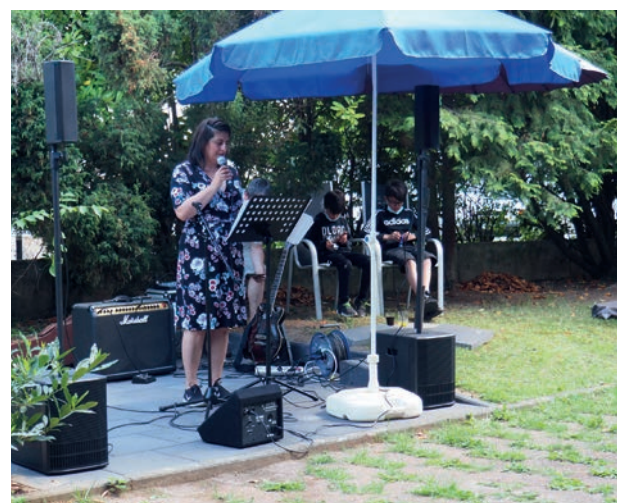
250 Jahre Beethoven – wir feiern ein kleines Beethovenfest im Garten des Wohnprojekts