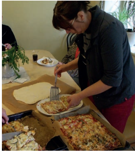
Pizzabacken für die Bewohner*innen in der Küche des Wohnprojekts