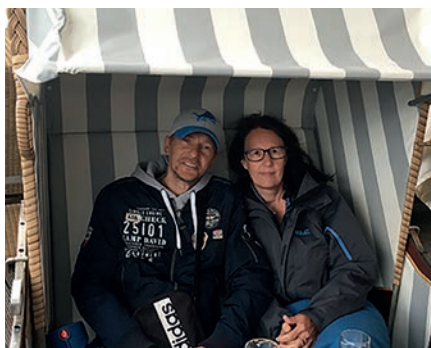
Für einen Bewohner wird ein großer Traum wahr. In Begleitung einer Ehrenamtlerin reist er an die Nordsee.