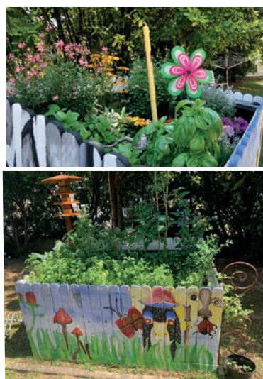
Neue Gartengestaltung: Ein Hochbeet wurde aufgestellt