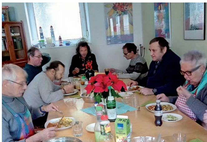
Im Gebäude des Wohnprojekts wurde eine große Küche eingerichtet. Durch das Engagement vieler ehrenamtlicher Mitstreiter*innen kann regelmäßig ein gemeinsames Mittagessen ermöglicht werden. Hier finden auch hin und wieder kleine Konzerte für die Bewohner*innen und Freund*innen von Bonn Lighthouse statt, z. B. die Konzerte der Initiative Live Music Now Köln e. V.